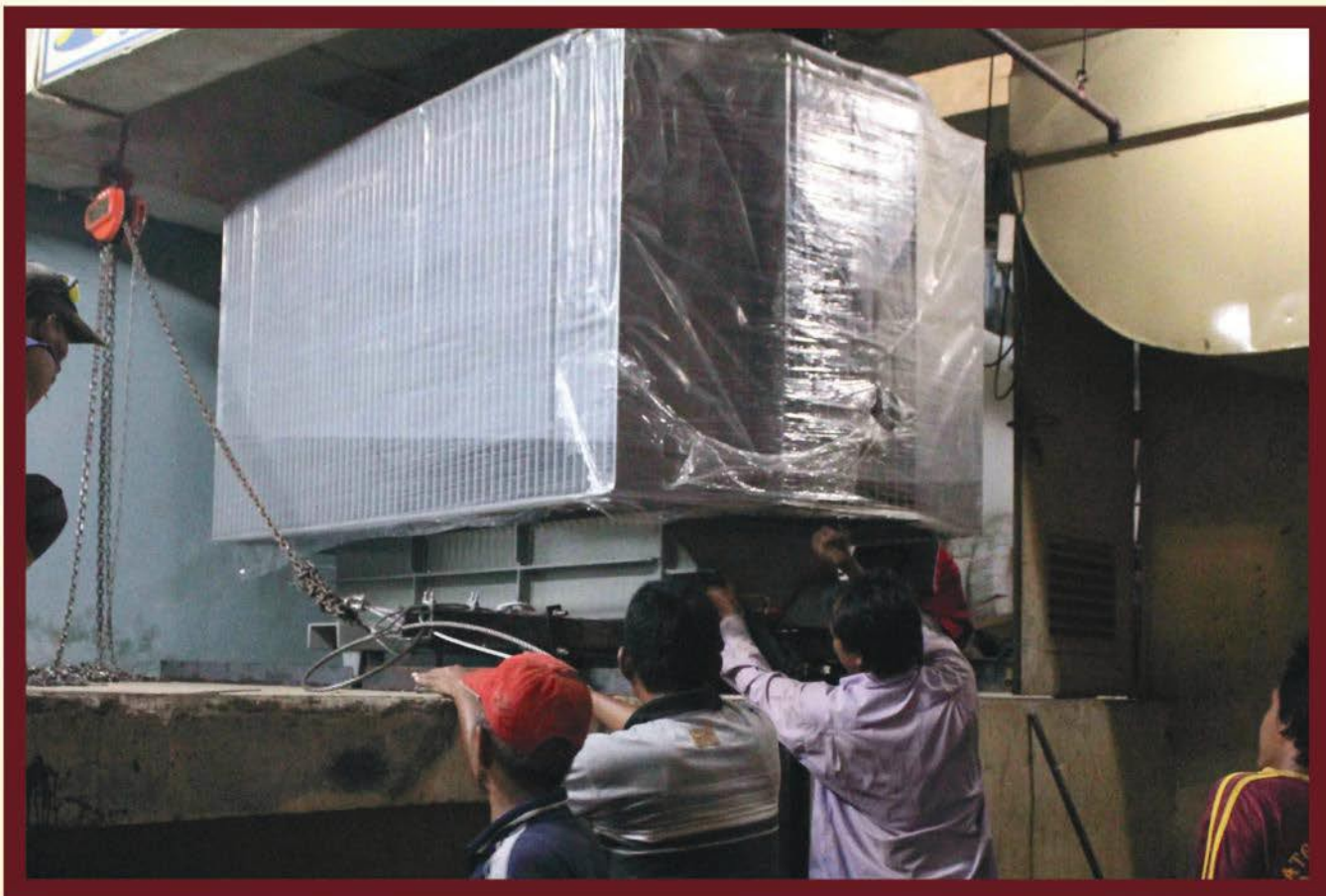
PROYEK PALEMBANG INDAH MALL