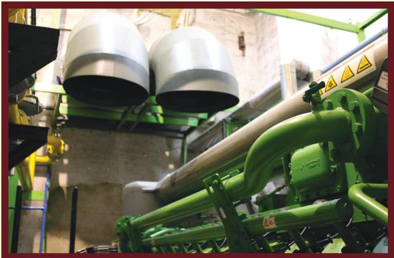
PROYEK PALEMBANG INDAH MALL