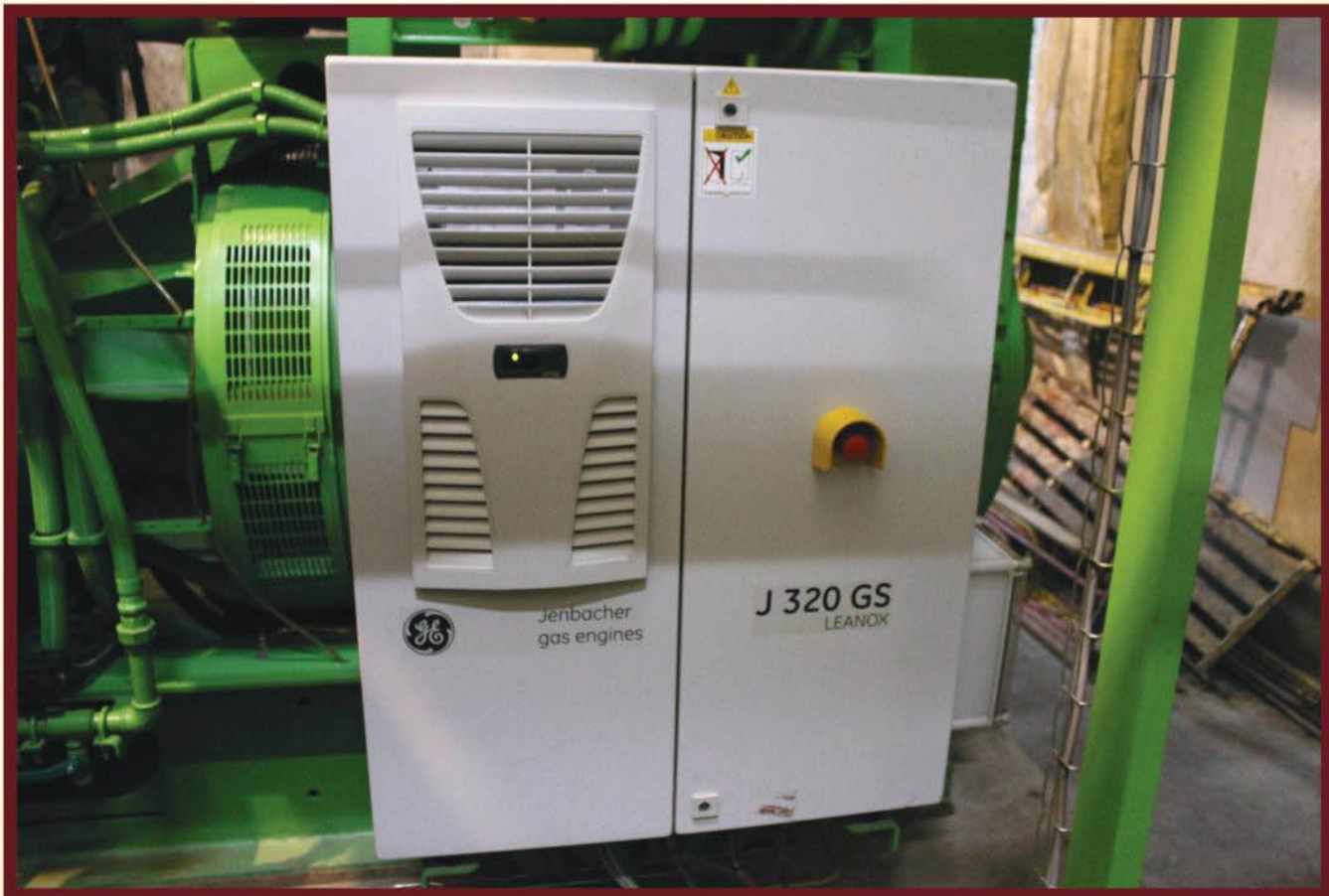
PROYEK PALEMBANG INDAH MALL