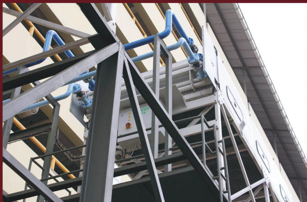
PROYEK PALEMBANG INDAH MALL