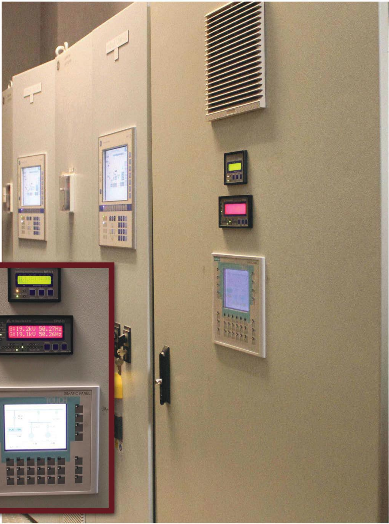
PROYEK PALEMBANG INDAH MALL